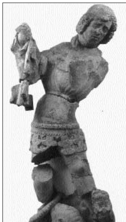
Sculptura da s. Gieri ord la catedrala da Berna, destruida durant l'iconoclassem a Berna 1528.

Dal 12avel fin il sedischavel secul reveva ina profunda pietusadad e ferma cardientscha. Il pievel fascheva gronds