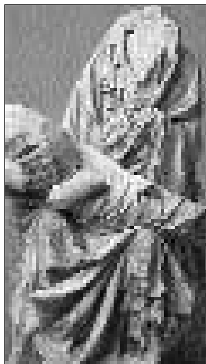
Pietà, ord la catedrala da Berna, destruida durant l'iconoclassem a Berna 1528; scuverta 1986.